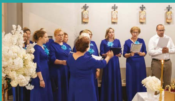
Chór z Parafii Prawosławnej w Narwi