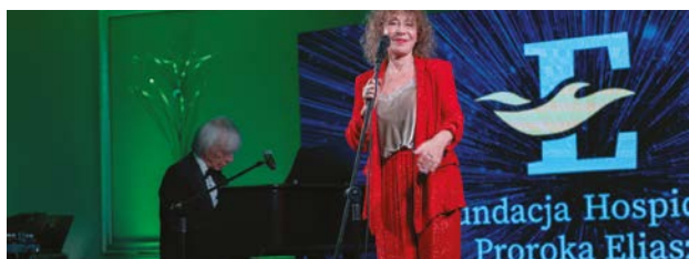
Występ Alicji Majewskiej i Włodzimierza Korcza