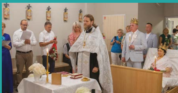
Ślub w hospicyjnej kaplicy