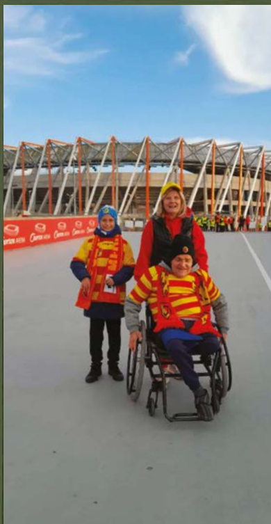
Przed wejściem na mecz