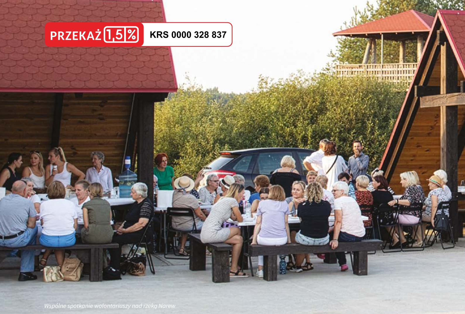
Wspólne spotkanie wolontariuszy nad rzeką Narew