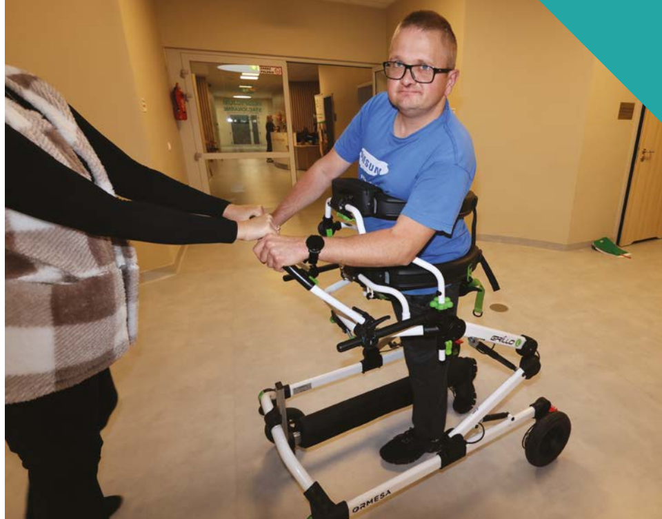
Pan Adam w trakcie zajęć fizjoterapeutycznych