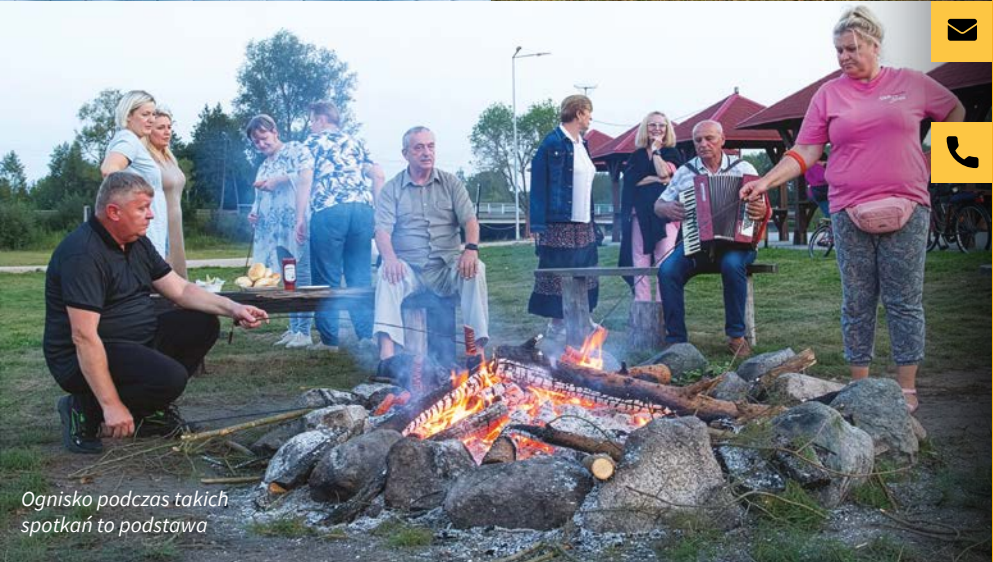
Ognisko podczas takich spotkań to podstawa