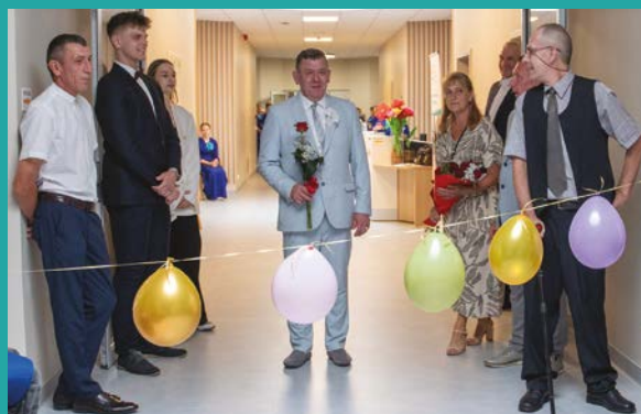
Brama z balonów zrobiona przez pacjentów

Niech ta historia będzie dowodem, że nigdy nie jest za późno, aby kochać, marzyć i świętować życie.