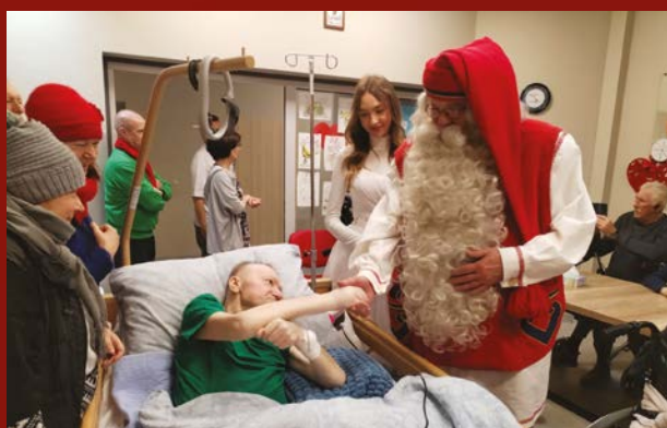
Święty Mikołaj z Rovaniemi u naszych pacjentów

Hospicjum wypełnia się zapachem żywych choinek, które stoją na korytarzach i w salach, a cała przestrzeń nabiera świątecznego ciepła. To czas przeżywany spokojnie i z ogromną uważnością na drugiego człowieka.