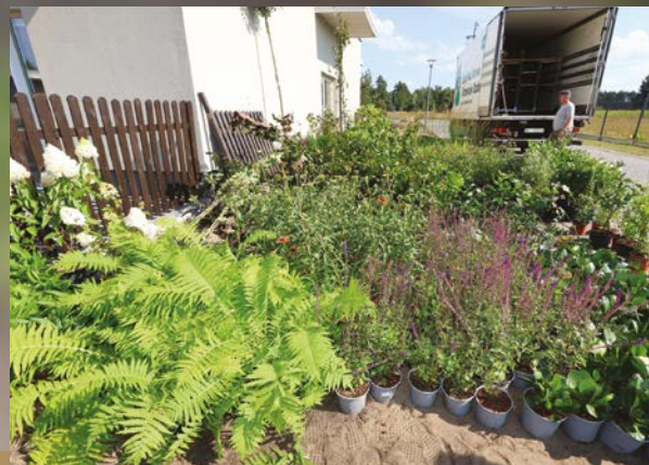
Rośliny czekają na sadzenie