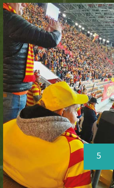
Stadion Miejski w Białymstoku /Chorten Arena

Dla nas, jako hospicjum, ta wycieczka to coś znacznie więcej niż tylko wspólne kibicowanie. To spełnianie marzeń, przywracanie nadziei i radości tam, gdzie codzienność bywa trudna. Czasem te drobne chwile szczęścia mają moc, by dodać sił i pozwolić poczuć, że życie, mimo wszystko, wciąż jest piękne i pełne możliwości.