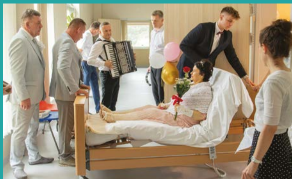
Zespół AS przygrywał podczas uroczystości