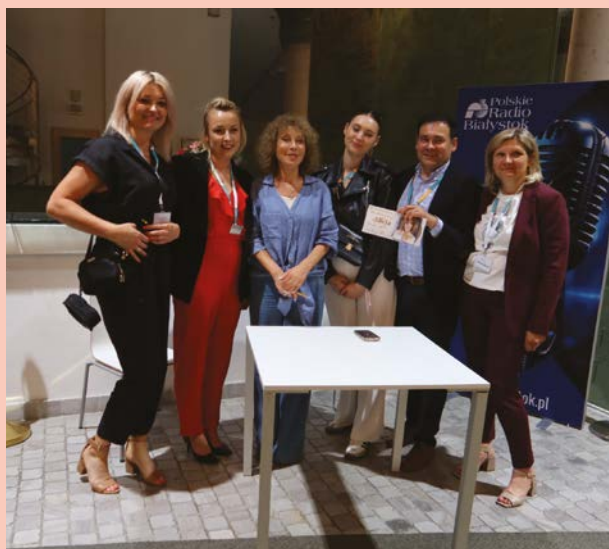
Wolontariusze i pracownicy hospicjum podczas zbiórki na koncercie Alicji Majewskiej

Kolejnym ważnym wydarzeniem była kwesta przeprowadzona podczas koncertu Alicji Majewskiej w Podlaskiej Operze i Filharmonii. W atmosferze muzycznego spotkania zapanowała także refleksja nad wartością wsparcia osób ciężko chorych i ich rodzin. Podczas koncertu pani Alicja Majewska z ogromną życzliwością i ciepłem opowiedziała o Hospicjum Proroka Eliasza w Makówce, w kilku poruszających słowach podkreśliła wyjątkowy charakter tego miejsca oraz znaczenie troski i obecności wobec osób chorych. Zachęciła również gości do udziału w zbiórce, dziękując wszystkim, którzy angażują się w niesienie pomocy i dobra.