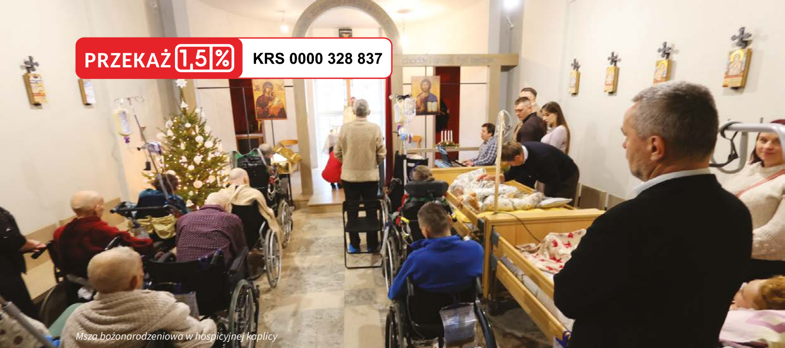
Msza bożonarodzeniowa w hospicyjnej kaplicy