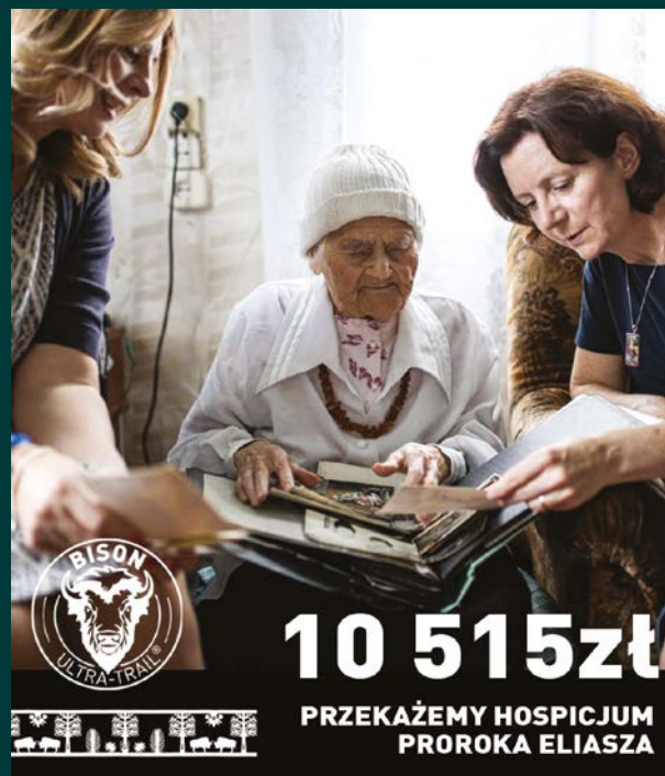
Realna pomoc dla naszych podopiecznych

Po raz kolejny odbyła się zbiórka darowizn prowadzona podczas zapisów na biegi Bison Ultra-Trail®. Zakończyła się dużym sukcesem i realnym wsparciem dla naszego hospicjum. Bison Ultra-Trail® to cykliczny bieg trailowy organizowany w malowniczej scenerii Knyszyńskiej Puszczy z bazą startową i metą w Supraślu, w którym w 2025 roku wzięło udział ponad 4000 osób z całej Polski, a także z zagranicy. To wyjątkowe wydarzenie sportowe organizowane w Supraślu już od kilku edycji łączy pasję do biegania z wrażliwością na potrzeby innych. Dzięki możliwości przekazywania datków podczas zapisów, biegacze i organizatorzy regularnie wspierają naszych podopiecznych, a z roku na rok przekazywana kwota jest coraz wyższa. Jesteśmy ogromnie wdzięczni za tę stałą obecność i zaufanie.