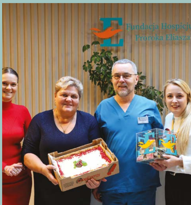
Właściciele Hotelu Cztery Pory Roku z odwiedzinami w hospicjum

Trafioną inicjatywą okazał się również kiermasz charytatywny na rzecz Hospicjum Proroka Eliasza, zorganizowany przez Hotel Cztery Pory Roku podczas Jarmarku Bożonarodzeniowego w Bielsku Podlaskim. Mieszkańcy miasta i okolic licznie odwiedzali stoisko, zatrzymując się, by spróbować świątecznych potraw i wypieków oraz aby wesprzeć inicjatywę.