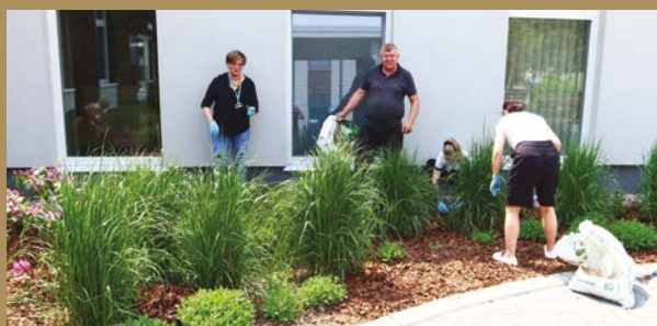
Pracownicy zasypują świeżą korę

To ogromny krok ku temu, by nasza placówka stawała się miejscem jeszcze bardziej przyjaznym, pełnym życia i nadziei, tak, jak chcieli tego twórcy ogrodu oraz wszyscy, którzy wspierali jego powstawanie. Już nie możemy doczekać się wiosny, kiedy wszystko wokół zacznie kwitnąć. Niech ten zielony zakątek będzie przestrzenią, w której odpoczywa serce i dusza.