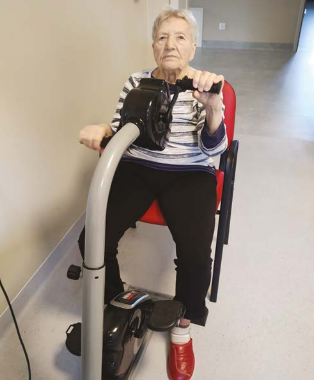
Pani Luba podczas pobytu w hospicjum w ramach „opieki wytchnieniowej”