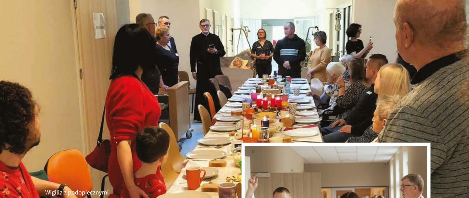
Wigilia z podopiecznymi