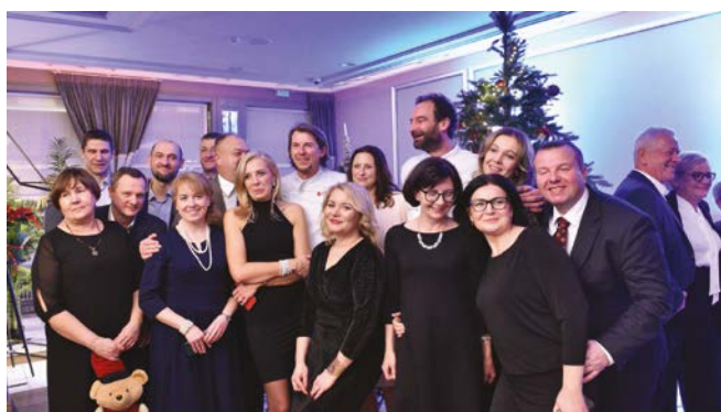
Tak się bawili nasi goście