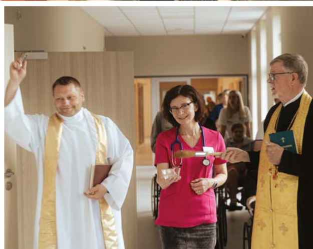
Otwarcie drugiego skrzydła hospicjum

W dalszym ciągu musimy dokładać do opieki nad naszymi podopiecznymi w hospicjum stacjonarnym, a niebawem będziemy musieli również pokrywać całościowe koszty pacjentów przyjętych do hospicjum domowego, którzy nie kwalifikują się do finansowania przez NFZ. Po wzroście inflacji koszt dziennej opieki nad pacjentem w hospicjum stacjonarnym zwiększył się z 667 zł. do 716 zł. (NFZ pokrywa 2/3 tej kwoty).