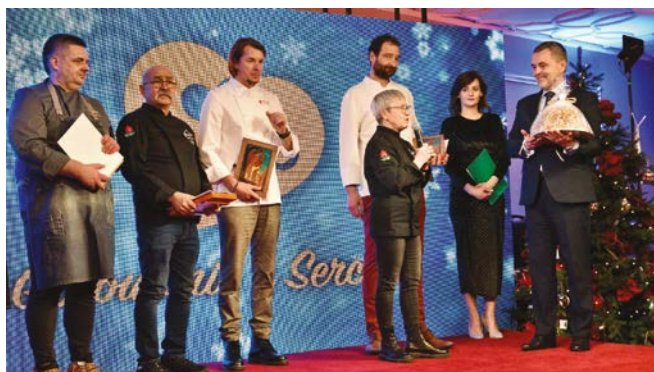
Podziękowania dla wspaniałych kucharzy

Z tego miejsca pragnę podziękować wszystkim, którzy wzięli udział w wydarzeniu. Kucharzom, firmom, licytującym – to dzięki Wam w mojej głowie zagościł spokój o jutrzejszy dzień, a w sercach naszych podopiecznych zagościła radość! Mam nadzieję, że w tym samym gronie spotkam się z Państwem za rok.