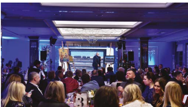
Licytacja w szczytnym celu

Nie możemy, ani nie wyobrażamy sobie tego, że moglibyśmy pozostawić naszych podopiecznych bez opieki nawet na jeden dzień, dlatego cały czas staramy się pozyskiwać środki na funkcjonowanie naszej Fundacji. Zewnętrzne finansowanie jest niewystarczające do świadczenia opieki na aktualnym, możliwie najwyższym poziomie, dlatego nieustannie szukamy nowych darczyńców.